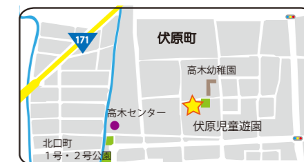
伏原児童遊園 位置図

公園を利用するさまざまな世代の人びとと士で、花と緑の活動を通じたコミュニケーションができれば、公園が地域コミュニティの場としてより重要なものとなります。地域の子供たちを花でつなぐ活動が、市内でも広がっていくと良いですね。